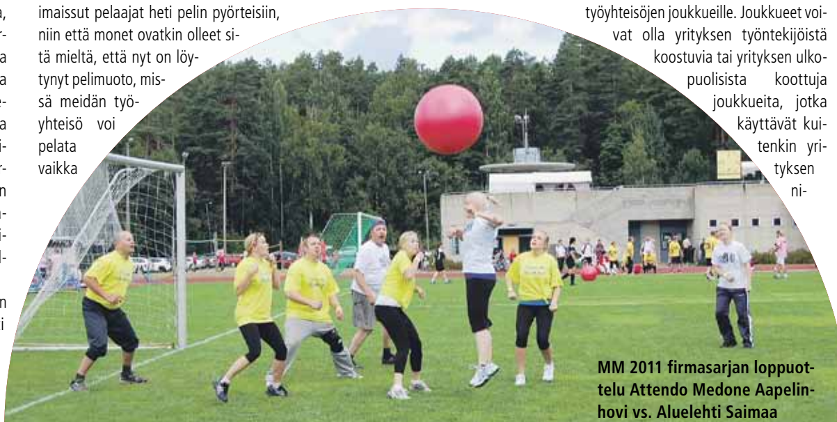
MM 2011 firmasarjan loppuottelu Attendo Medone Apelin-hovi vs. Aluelehti Saimaa

Lauantaina ja sunnuntaina 11.–12.8.2012 käytävään kilpasarjaan otetaan 24 ensiksi ilmoittautunutta joukkuetta ja suosituimpaan harrastajasarjaan otetaan mukaan yhteensä 64 ensiksi ilmoittautunutta joukkuetta. Ilmoittautuminen ensi kesän MM-kisoihin on käynnissä. Ilmoittautuminen sekä lisätiedot MM-kilpailuista ja lajiesittely löytyy uudesta nettiosoitteesta www.norsupallo.fi